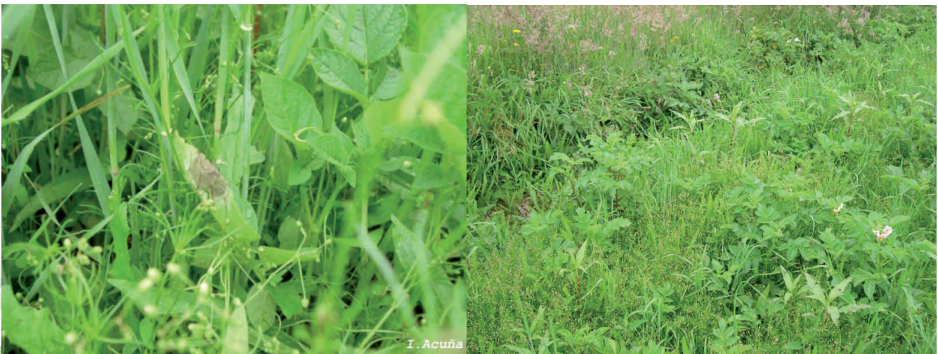
Foto 3. Plantas voluntarias de papa, una de las principales fuentes de infección de P. infestans .