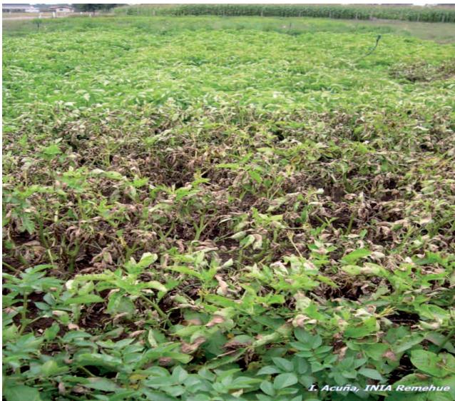
Foto 2. Foco de tizón tardío en una plantación de papa

La primera y principal fuente del hongo en las zonas productoras de papa en Chile son los tubérculos, ya sea tubérculos semillas infectados, tubérculos invernantes de plantaciones de años anteriores que dan origen a papas voluntarias (plantas huachas ó bochen), ó tubérculos de desecho. Desde estos tubérculos infectados el hongo crece alcanzando los brotes, donde produce las estructuras reproductivas llamadas esporangios. Desde esta planta enferma, el hongo es llevado por el agua de lluvia y el viento depositándose en hojas y tallos húmedos, donde inician una nueva infección. Estas nuevas lesiones forman focos de infección en las plantaciones de papa, siendo una gran fuente del hongo para plantaciones cercanas y los nuevos tubérculos (Foto 2).