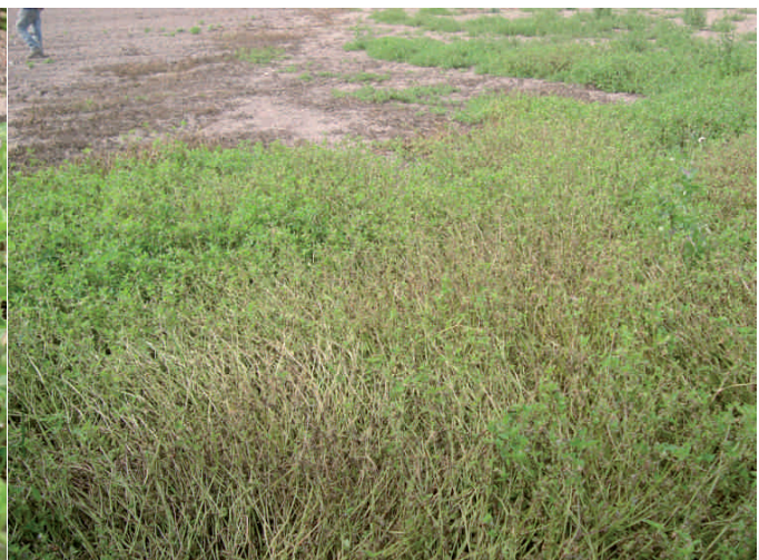
Foto 5. Planta de tomatillo ( Solanum nigrum ) afectada por tizón tardío