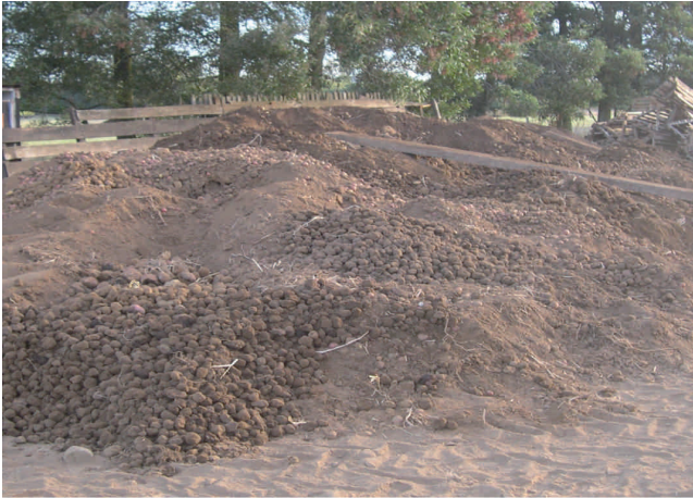
Foto 4. Los tubérculos de desecho son fuente de inóculo potencial de tizón tardío.